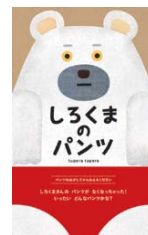
「しろくまのパンツ」プロンス新社