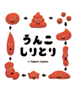
「うんこしりとり」白泉社