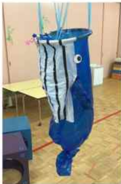
〈 食べる前 〉